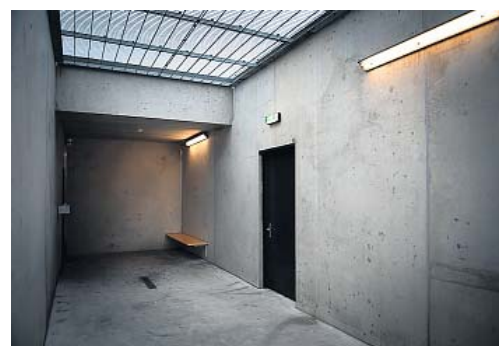
▲ Kale gangen in het cellencomplex