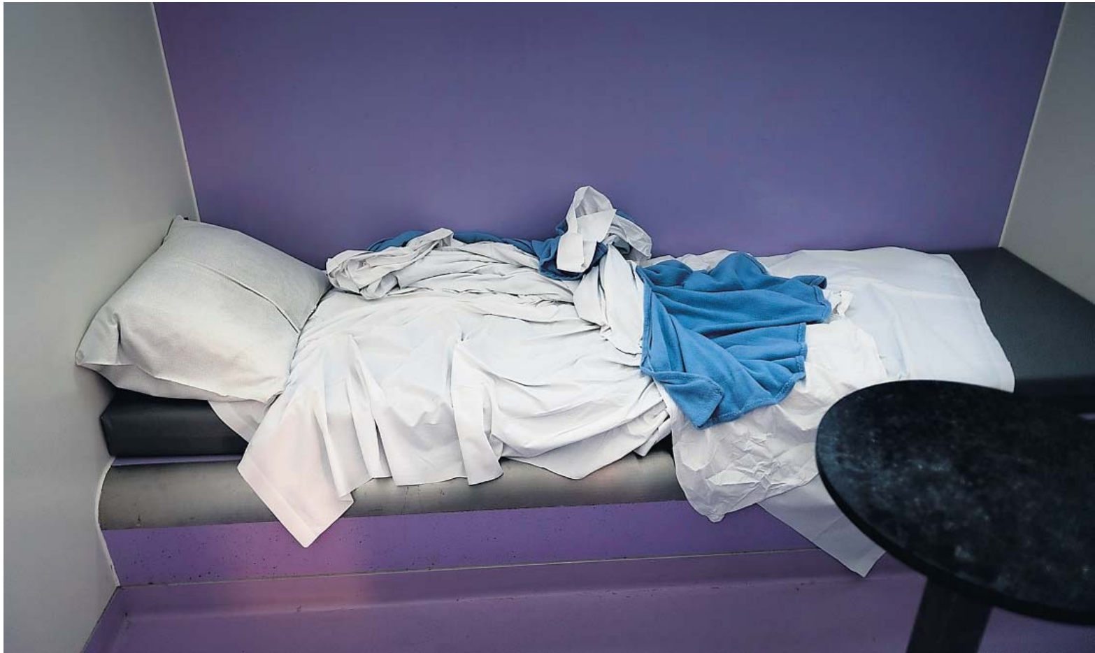
◀ De cellen zijn klein en kaal, met een vast bed, een toilet van roestvrij staal en een ingebouwde televisie.

Gerke doet 's ochtends de koffieronde. 'Moi 'em. Hoe lang moet je? Drie dagen? Nou 't ergste is dan dat je drie dagen tegen mijn gezicht aan moet kijken. Koffie of thee?' De verdachte - slaperig, boxershorts, T-shirt - blijft koffie. Het is een doordeweekse dag en het is rustig in het cellencomplex aan de Hooghoudtstraat in Groningen. Elf mensen zitten achter de deur, onder wie een paar justitieklanten. Mannen met openstaande boetes.