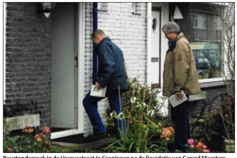
Buurtonderzoek in de Uranusstraat in Groningen na de liquidatie van Gerard Meesters.