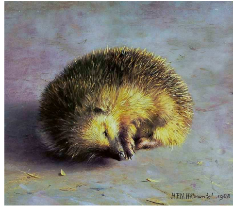
Dit schilderij van een egeltje van Henk Helmantel was het bekendste van de buitgemaakte doeken. Daarom werd de ploeg rechercheurs die de zaak onderzocht en oploste aangeduid als het Egeltjesteam.

Probleem voor de politie: de daders bellen wel met Helmantel, maar vanuit een telefooncel. Die